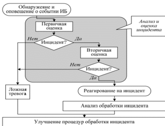
1-сурет. АҚ оқиғаларын өңдеуді басқару

АҚ оқиғаларын өңдеудегі рөлдерді бөлу және АЖ оқиғаларын өңдеу тәртібі туралы ұсыныстар берілген. АҚ оқиғаларын өңдеуді басқару сызбасы [2,3]-ке сәйкесінше 1-суретте көрсетілген.